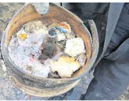
In den Abfällen der Gelben Tonnen wurde im Januar ein Teil einer Granate gefunden.

Am 21. Januar 2022 wurde in den Abfällen aus den Gelben Tonnen im Landkreis Zwickau ein Teil einer Granate gefunden. Daraufhin musste der Betrieb sicherheits halber eingestellt, der Umschlagplatz geräumt sowie der Kampfmittelbeseitigungsdienst angefordert werden.