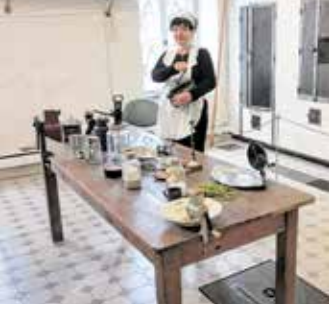
Blick in die Küche im Schloss Waldenburg