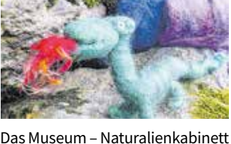
Im Kreativraum kann am 19. Februar gefilzt werden.

Das Naturalienkabinett Waldenburg lädt ein