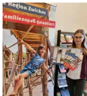
Neue Printprodukte geben Tipps für die Freizeitgestaltung.

Diese Printprodukte entstanden mit freundlicher Unterstützung der Sparkassen Chemnitz und Zwickau.