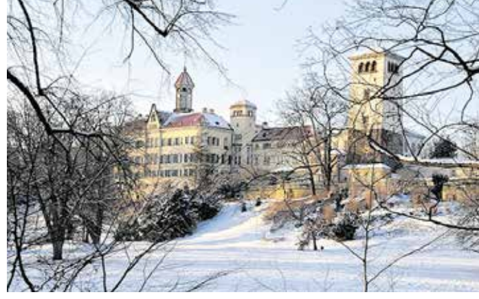
Südseite des Schlosses Waldenburg

Ein mit Sicherheit interessanter Vortrag für Jedermann ist der Vortrag „Fürsten, Sammler, Missionare“ am 24. März 2022 um 18:00 Uhr mit dem Provenienz-Forscher und Afrikanist Dr. Lutz Mücke. Die Provenienzforschung widmet sich der Geschichte der Herkunft (Provenienz) von Kunstwerken und Kulturgütern. Im Anschluss an den Vortrag erleben die Gäste eine gemeinsame Führung im Museum Naturalienkabinett vis-à-vis. Preis Kartenvorverkauf: 14,90 Euro