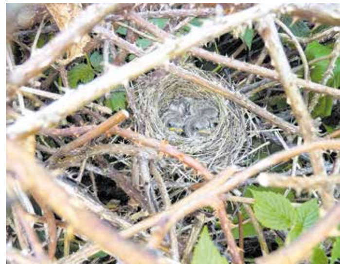
Neuntöter im Nest

Insbesondere können Vögel, Fledermäuse oder holzbewohnende Käferarten in Bäumen Höhlen, Spalten oder Nischen teilweise