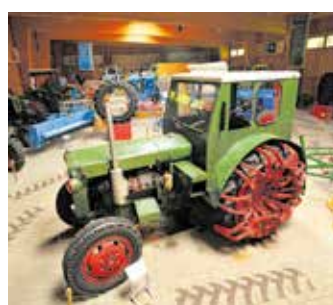
Blick in die Traktorenhalle

Am Sonntag, dem 13. März 2022 , findet im Deutschen Landwirtschaftsmuseum Schloss Blankenhain um 14:00 Uhr eine Sonntagsführung zu den in dessen Ausstellungen präsentierten Traktoren statt.