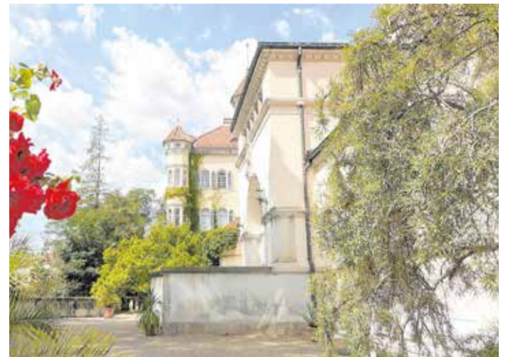
Schloss Waldenburg

Vom 7. bis 12. November 2022 lädt der Landkreis Ludwigsburg zum traditionellen Spätlingsmarkt ein. Viele tausend Besucher genießen alljährlich die Spezialitäten aus der eigenen Region, aber auch aus den Gastregionen des Partnerlandkreises. Schon über zwei Jahrzehnte ist auch der Landkreis Zwickau zusammen mit seinen Partnern, dem Tourismusregion Zwickau e. V. sowie der Tourismus und Sport GmbH zu Gast, um mit Sächsischen und vor allem regionalen