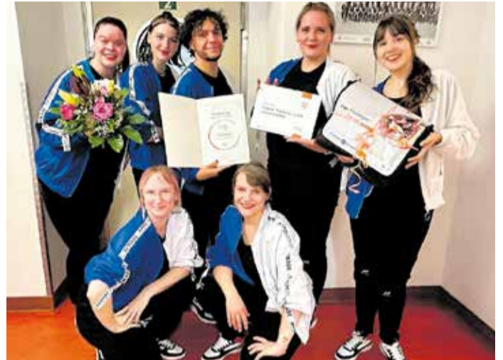
Die Tänzerinnen und Tänzer von M.I.D. freuten sich über die Auszeichnung.

Der Verein dankt allen, die sich täglich für die Kinder und Jugendlichen im Verein einsetzen.