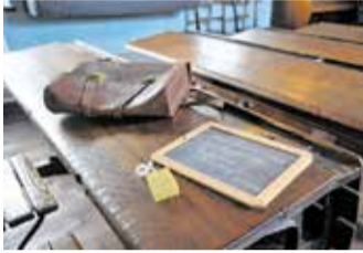
Blick in die Alte Dorfschule

Besichtigung der Alten Dorfschule und Führung zur Rittergutgeschichte