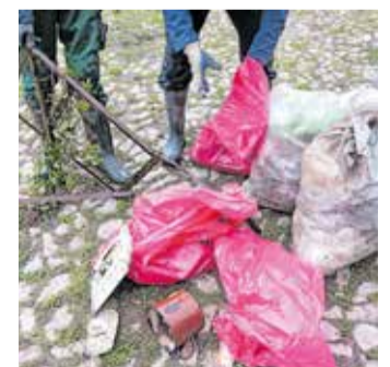
Neun Kommunen beteiligten sich am World Cleanup Day.

Diese Maßnahme wird mitfinanziert durch Steuermittel auf der Grundlage des von den Abgeordneten des Sächsischen Landtags beschlossenen Haushaltes.