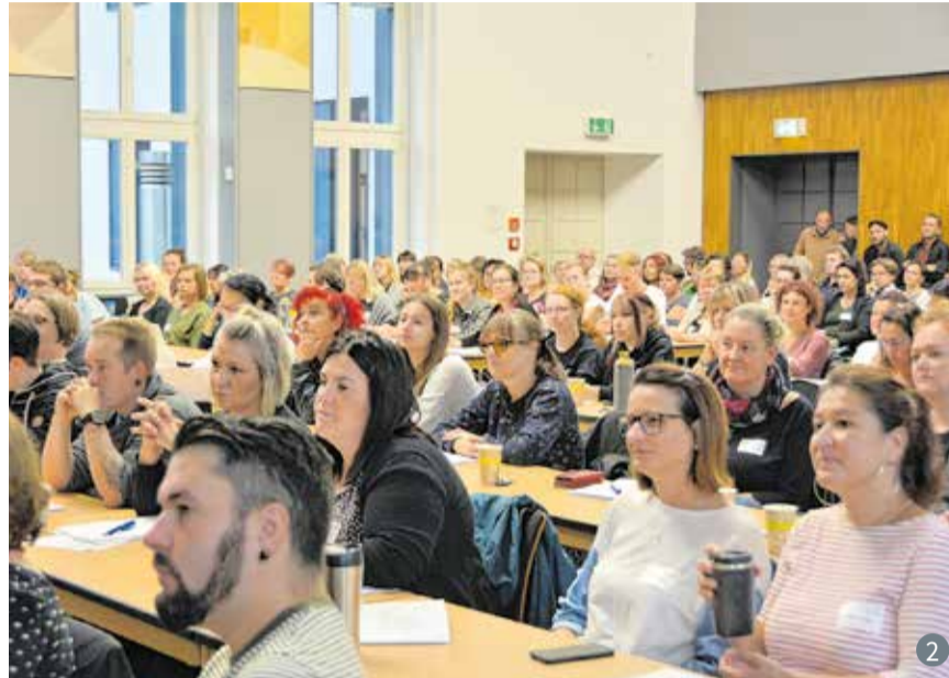
1 Prof. Dr. Gerd Drechsler eröffnete die Veranstaltung. 2 Über 200 Fachkräfte, Mitarbeiterinnen und Mitarbeiter sowie weitere Interessierte waren zum 10. Jugendhilfetag in die Westsächsische Hochschule Zwickau gekommen.

Am 14. September 2022 fand an der Westsächsischen Hochschule Zwickau der 10. Jugendhilfetag zum Thema „Jugendhilfe - Ein Blick in die Zukunft. Herausforderungen jetzt und künftig.“ statt.