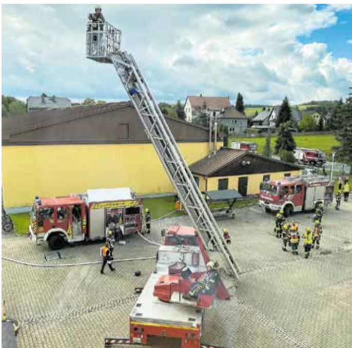
Am 16. September 2022 fand an der Jakobus-Oberschule in Mülsen eine behördenübergreifende Übung statt.

Am 16. September 2022 gegen 10 Uhr gingen in den Rettungsleitstellen von Polizei und Feuerwehr Notrufe zu einem Großschadensereignis ein. Hierbei handelte es sich um eine behördenübergreifende Übung des Landkreises