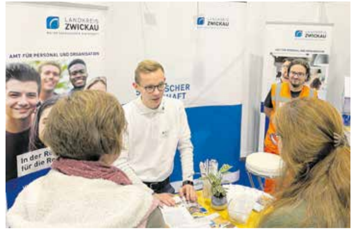
Auszubildende des zweiten und dritten Lehrjahres informierten die Besucher zu den Ausbildungsberufen in der Landratsverwaltung.

Die Behörde hofft nun, dass im Ergebnis des Messebesuches zahlreiche Bewerbungen auf die drei Studiengänge und fünf Ausbildungsberufe, die kommendes Jahr durch das Landratsamt angeboten werden, eingehen.