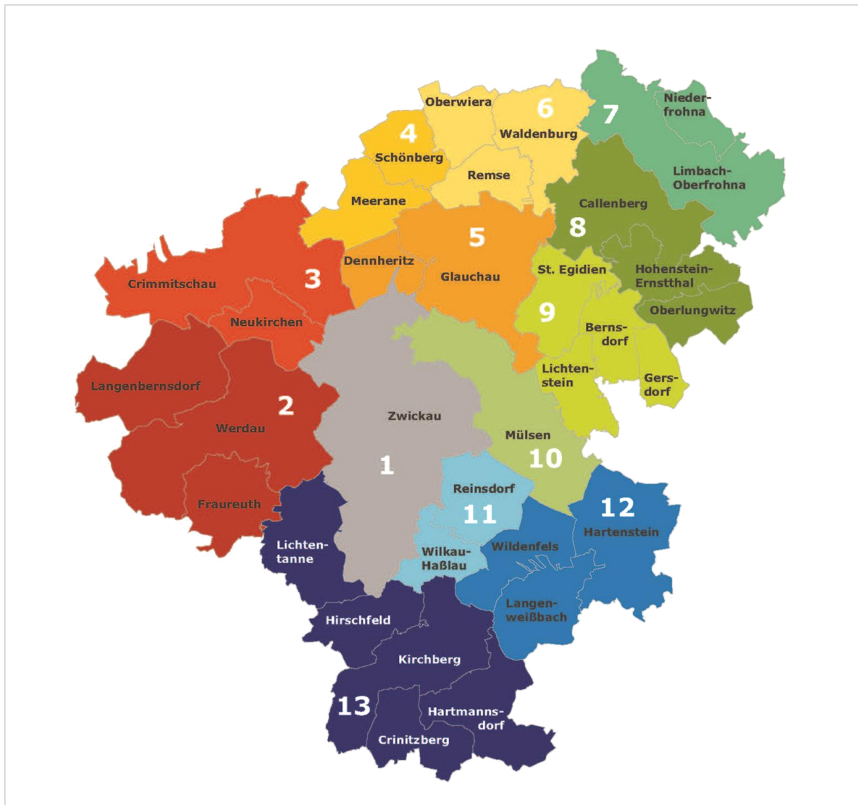
Abbildung 1: Sozialräume

Hinsichtlich der Rückmeldungen lag Sozialraum 5 mit acht Antworten (inkl. Fehlmeldung) und sieben Angeboten für Seniorinnen und Senioren an zweiter Stelle hinter Sozialraum 1. Von den sieben Angeboten wurden vier Angebote über die Amtsblätter/AG Seniorenbildung gemeldet. Angeschrieben wurden 12 Einrichtungen.